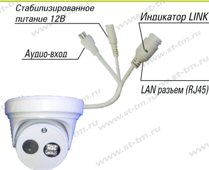
Рис. 1 Схема подключения